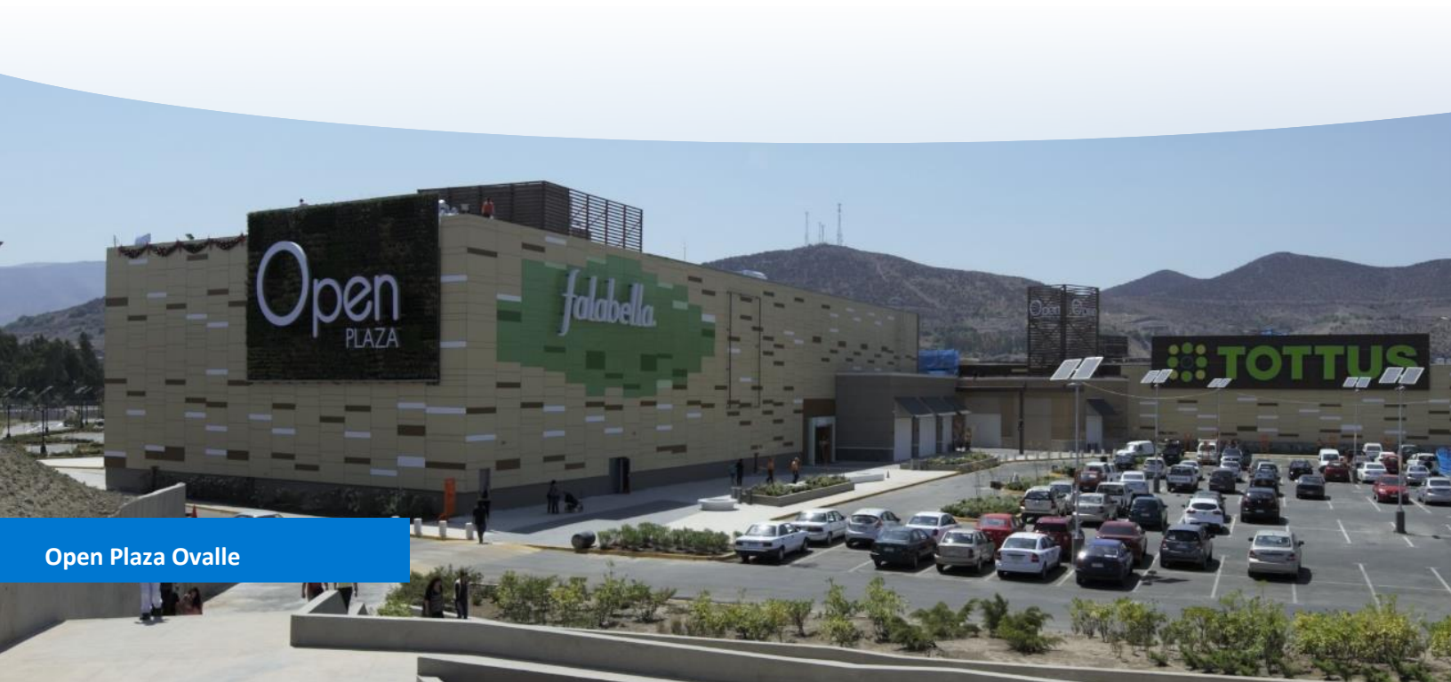
Open Plaza Ovalle