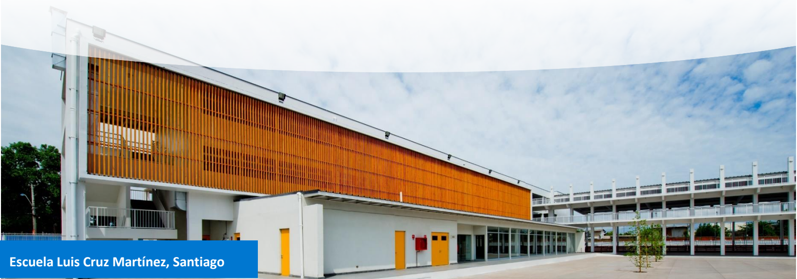
Escuela Luis Cruz Martínez, Santiago