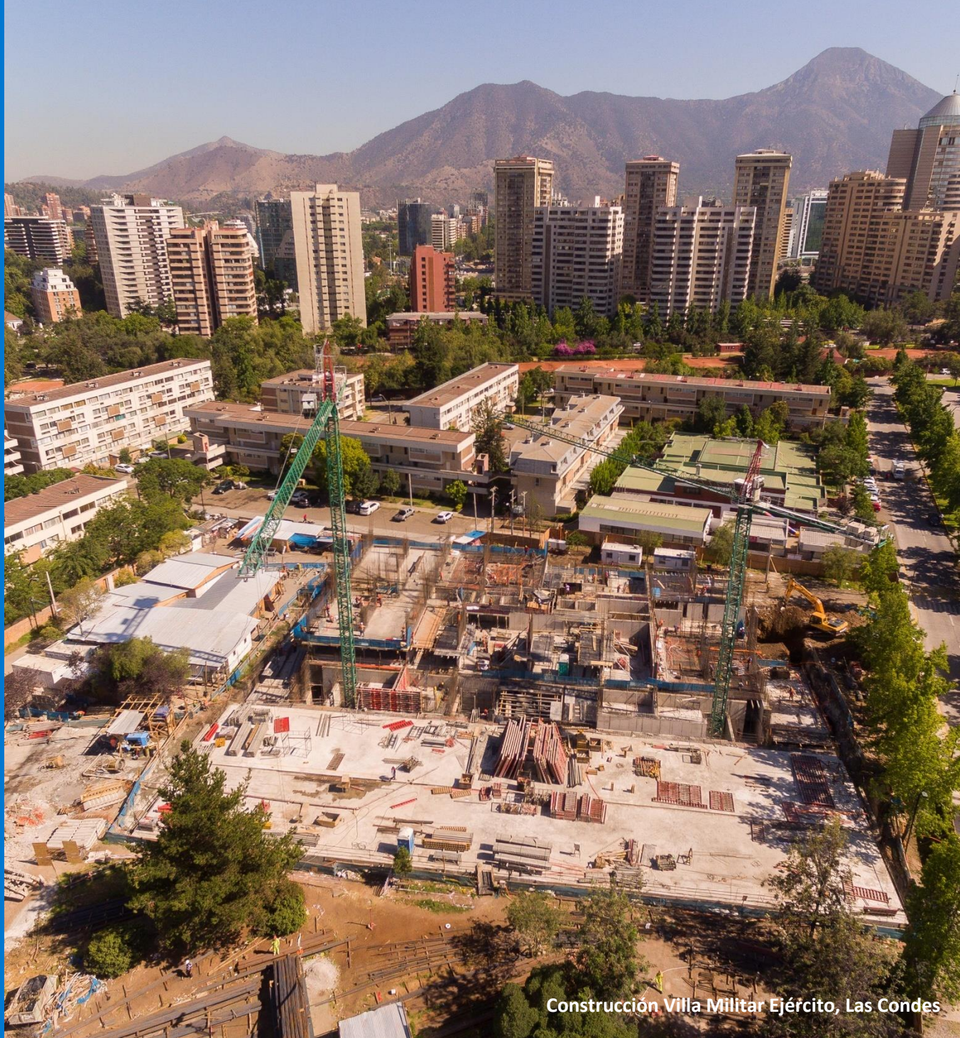
Construcción Villa Militar Ejército, Las Condes